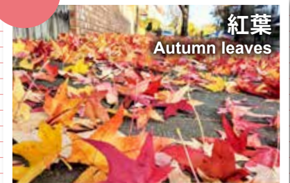
紅葉 Autumn leaves

Regent's Park (NW1 4NR)、St James's Park (SW1A 2BJ)、Richmond Park (TW10 5HS) ほか