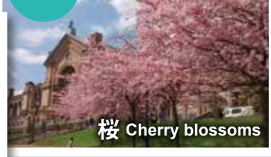
桜 Cherry blossoms

Royal Botanic Gardens Kew (TW9 3AB)、Regent's Park (NW1 4NR)、Alexandra Palace (N22 7AY) ほか