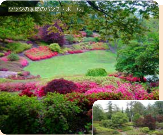
ツツジの季節のパンチ・ボール。

④ 柵が見えたら、これが目印。奥に向かってなだらかな坂をあがっていけばパンチ・ボールに到達。