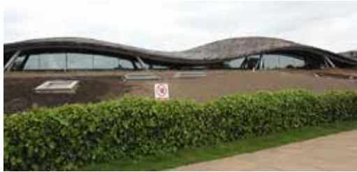
波形の屋根がやわらかい印象を与える、サヴィル・ガーデン・ビルディング。

駐車料金は有料(会員は無料)だが、パーク内への入場は無料。すべての国民に開かれた空間といえる。自然を慈しみ、次世代に引き継ぐことも意識しながら、思い思いに過ごし、パークでの時間を存分に楽しみたいもの。ツツジ、シャクナゲが美しいこの季節に足をのびしてみたいかがだろうか。