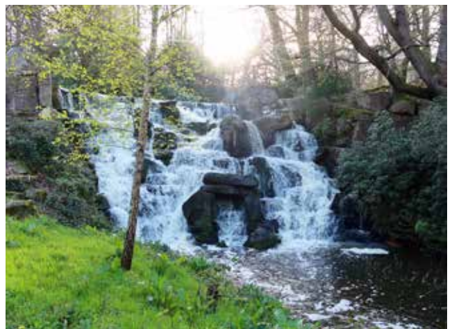
ヴァージニア・ウオーターで、最も人気の高い撮影スポット、カスケード The Cascade（階段状の滝）。高さは10メートルあり、1750年代に造られたものの1768年の大嵐で損壊。その後、再建された。長距離を歩くことが難しい人がグループ内にいる場合は、ヴァージニア・ウオーター駐車場が便利。徒歩10分ほど。

た、お抱え建築家ヘンリー・フリトクロフト、ジョン・ヴァーデー、地形製図家トマス・サンドビーらに命じ、貯水湖ヴァージニア・ウオーターを造らせた。この大工事は1752年に始まり、40年もの時間を要した。ヴァージニア・ウオーター湖畔でのピクニック